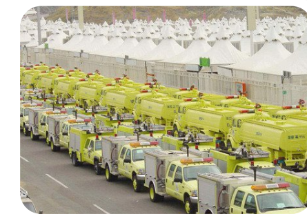
حلول للدفاع المدني والحماية المدنية