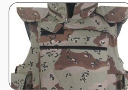
حلول تصفيح الأفراد