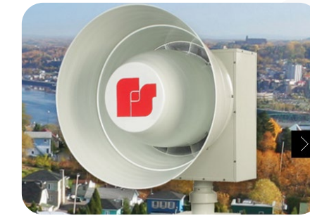
حلول الإنذار الميكرو وصفارات الإنذار