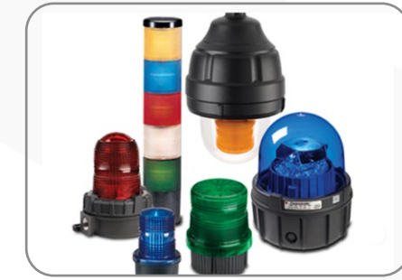
حلول الأمن والحماية للقطاع الصناعي