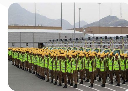
حلول تنظيم الحشود (حشود الحج)