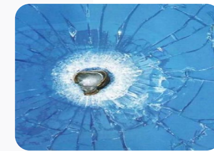
حلول تصفيح المركبات