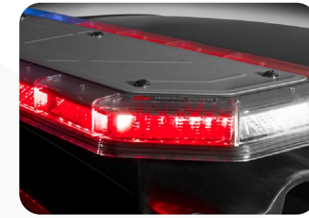
الأضواء الأمنية وصفارات الإنذار لسيارات الأمن